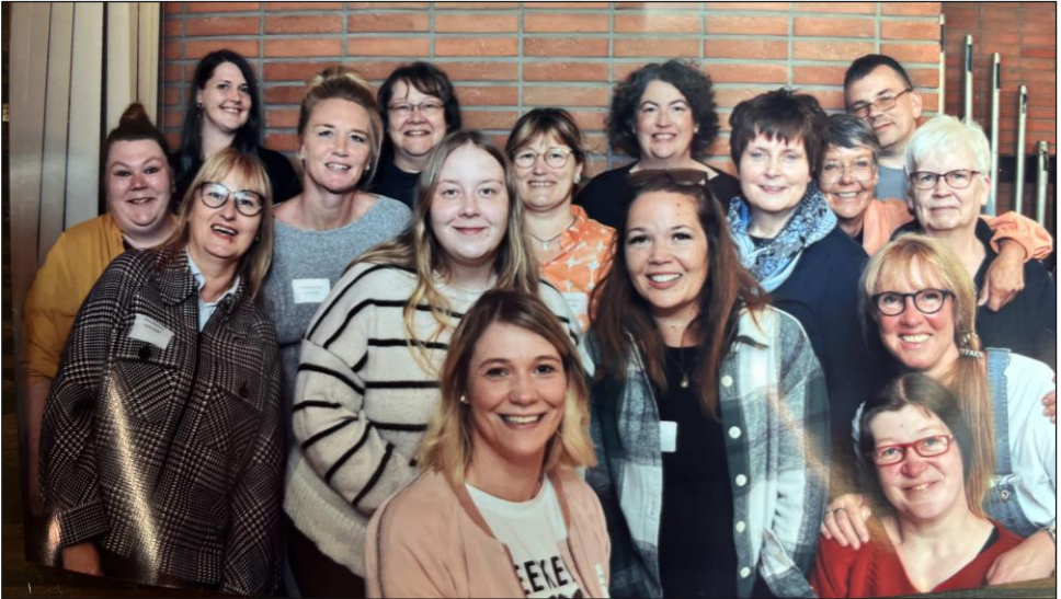
Das Team unserer KiTa Arche Noah beim Fachtag zur KiTa-Verbandsgründung am 13. Juni.